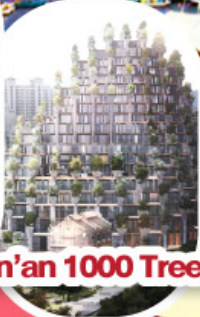
Tian'an 1000 Trees