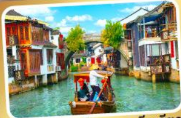
ล่องเรือเมืองโบราณซูเจียเจียว