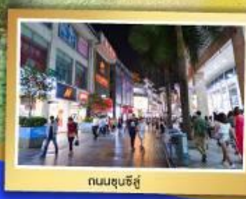
ถนนชุนชิว