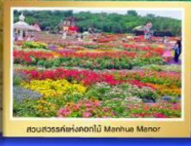
สวนสวรรค์แห่งดอกไม้ Manhua Manor