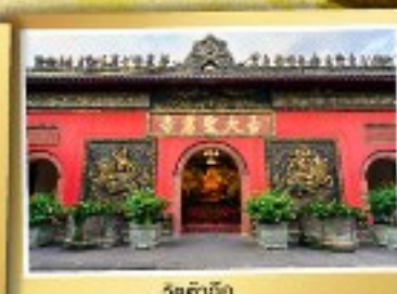
วัดต้าเจี๋ย