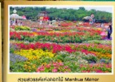
สวนสวรรค์ดอกไม้สีฤดู Mingshan Meme