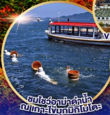
ชมโชว์อากาฮาคาเนะ ณ เกาะโงซุซึกิโกโมโตะ