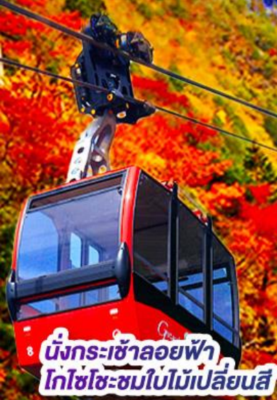
นั่งกระเช้าลอยฟ้า โกโซโซะชมใบไม้เปลี่ยนสี