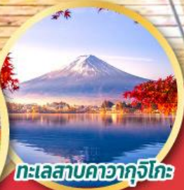
ทะเลสาบคาอากุจิโกะ