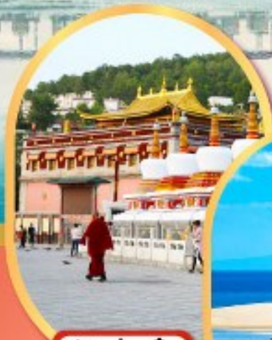
วัดต้าอ้อ