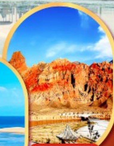
หุบเขาห้าสี อุทยานธรณีกุยเต๋อ