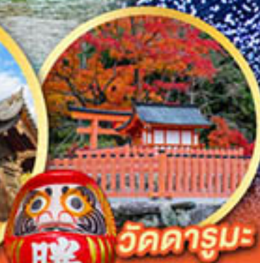
วัดคารุมะ