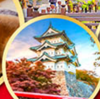
ปราสาทฮิโรซากิ