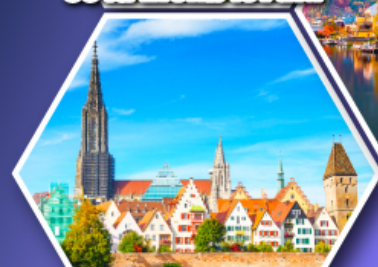
อูล์มบ้านเกิดไอน์สไตน์