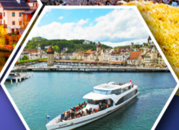
ล่องเรือทะเลสาบลูเซิร์น

การ์นตี พักค้างคืนบนยอดเขาพีลาตุส ยอดเขาคินมิงกรแห่งสวิตเซอร์แลนด์