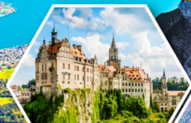
ปราสาทชิกมาริงเก็ม

ฟรี ประกันสุขภาพ และอุบัติเหตุ คุ้มครองสูงสุด 3 ล้านบาท *เงื่อนไขขึ้นอยู่กับกรมธรรม์ประกันภัย