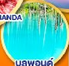
บรูพอนด์ (บ่อน้ำสีฟ้า)

พักโจเซ็งเคออนเซ็น 1 คืน พักโรงแรมในชิบโปโร 3 คืน