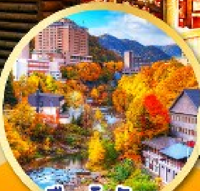
เมืองโจเซ็งเค