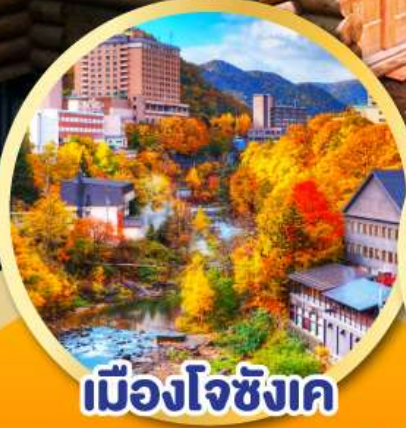
เมืองโจซังเค