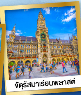
จัตุรัสมาเรียนพลาสต์