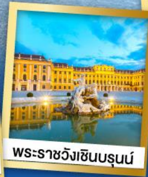
พระราชวังเซ็นบรุนน์