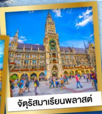
จัตุรัสมาเรียนพลาสต์

28 ธ.ค.67-05 ม.ค.68 95,900 12-20 ก.พ., 12-20 มี.ค.68 89,900