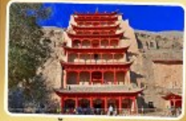
กำแพงสะลักม่อเกา