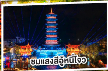
ชมแสงสีอุโมงค์