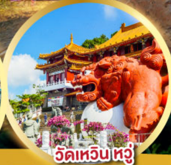
วัดเหวินหู๋