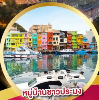
หมู่บ้านชาวประมง