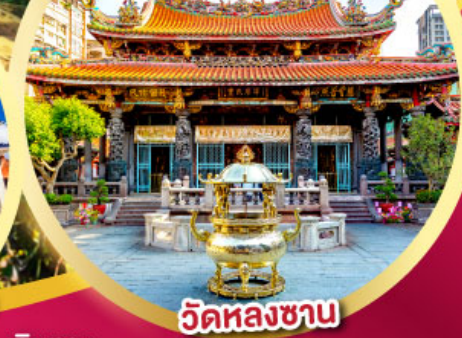
วัดหลงชาน