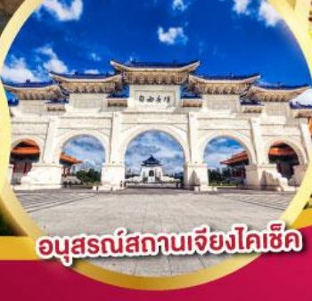
อนุสรณ์สถานเจียงโคเซ็ค