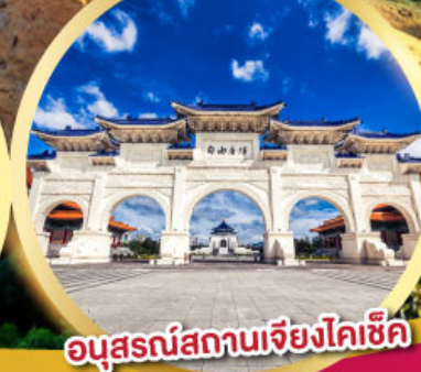
อนุสรณ์สถานเจียงโคเซ็ค