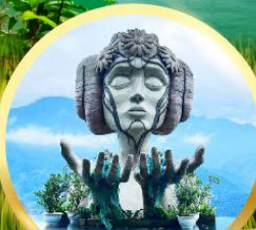
โมนาน่า ซาปา คาเฟ่