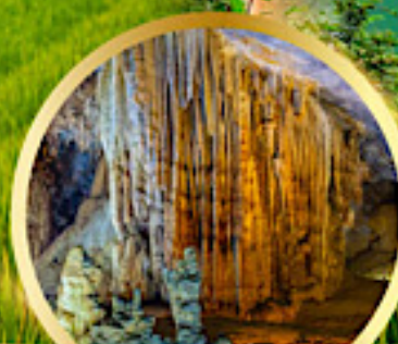
ถ้ำสวรรค์