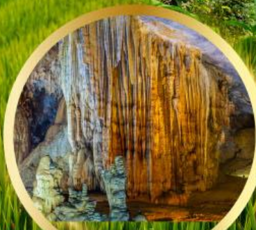
ถ้ำสวรรค์