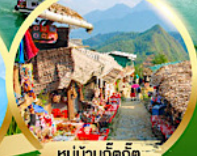
หมู่บ้านก๊ตก๊ต