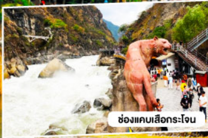
ช่องแคบเสื่อกระโจน