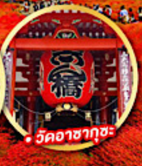
• วิชาซาคุซะ

พักโรงแรมในโตเกียว 2 คืน พักออนเซ็น 2 คืน