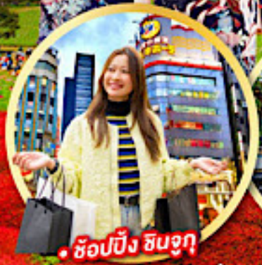
• ช้อปปิ้ง ชินจูกุ

กิจกรรมใส่ชุดกิโมโน พร้อมชมโชว์การแสดงต่างๆ