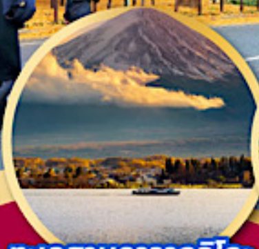
ทะเลสาบคาวากุจิโกะ