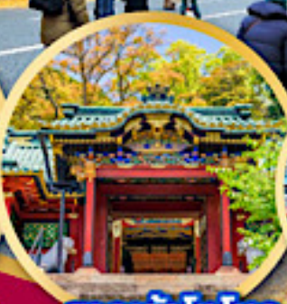
ศาลเจ้าโทโชคุ