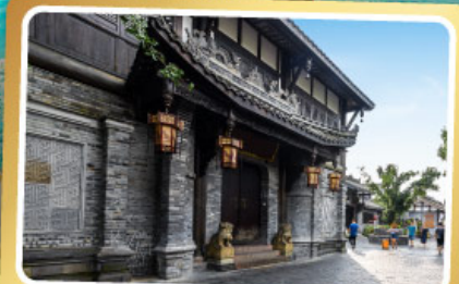
ถนนควานโจ๋เซียงจื่อ