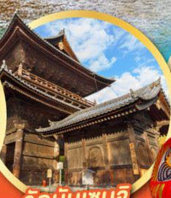
วัดนินเซนจิ