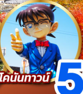
โคนันทาวน์