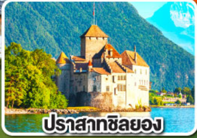
ปราสาทซิลยง