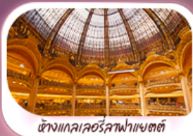
ห้างแกลเลอรีลูฟวร์