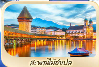
สะพานไมซ์าเปล