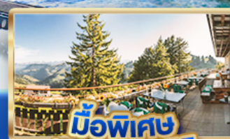
มือพิเศษ บนยอดเขารัก