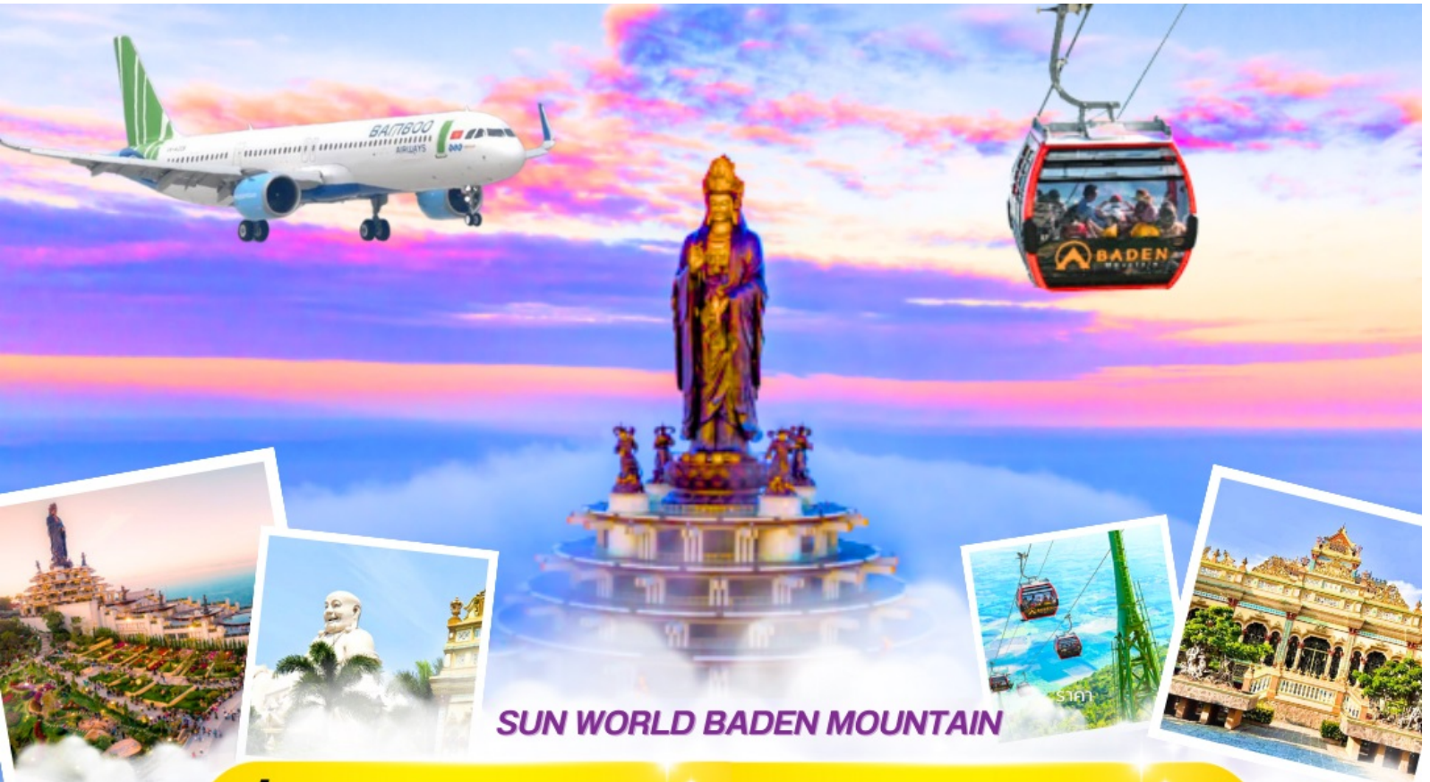
SUN WORLD BADEN MOUNTAIN

นั่งกระเช้าลอยฟ้า ตามหายอดเขาศักดิ์สิทธิ์