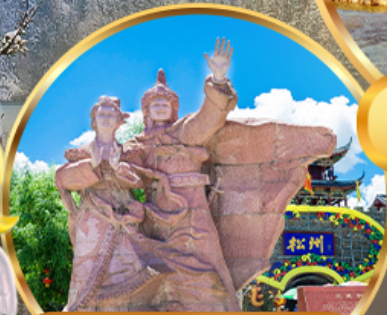
เมืองโบราณขงพาน