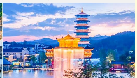
ล่องเรือชมแสงสียามค่ำคืนฉู่หนี่โจว

*ทางบริษัทฯ ขอสงวนสิทธิ์ในการสลับโปรแกรมทัวร์ตามความเหมาะสมขึ้นอยู่กับสถานการณ์หน้างาน โดยคำนึงถึงผลประโยชน์ของลูกค้าเป็นสำคัญ