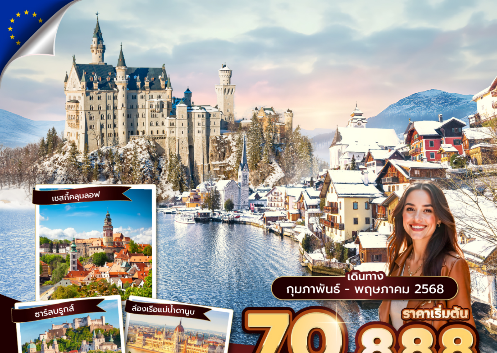
เชสกีคลุมลอฟ