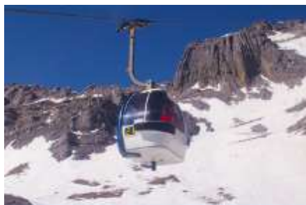
ภูเขาหิมะมังกรหยก (มังกรชะง้าใหญ่)

ที่พัก FENG HUANG HOTEL ระดับ 4 ดาว หรือเทียบเท่าเมืองลี่เจียง