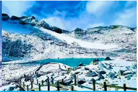
ทะเลสาบต้ากู่