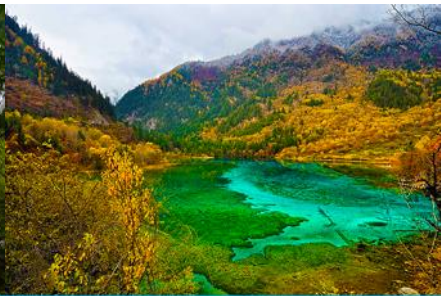
ทะเลสาบนกยูง (PEACOCK LAKE)