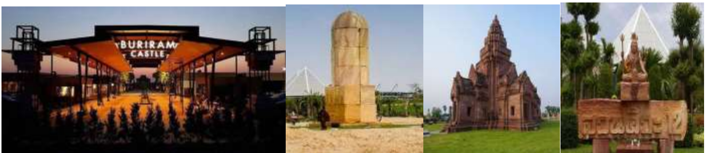
พักที่(N1) โรงแรม r2 (จ.บุรีรัมย์) หรือเทียบเท่า

18.00 น. รับประทานอาหารค่ำอิสระ ที่ BURIRAM CASTLE เป็นส่วนหนึ่งของ BURIRAM UNITED ตั้งอยู่ระหว่างสนาม Chang ARENA และสนามแข่งรถระดับโลก CHANG INTERNATIONAL CIRCUIT พื้นที่ขนาด 93,000 ตร.ม. แบ่งเป็น Avenue Area 35,000 ตร.ม. ,ปราสาทหินพนมรุ้งจำลอง 14,000 ตร.ม., สวนไม้ดอก ไม้ประดับ และสวนตะบองเพชร 35,000 ตร.ม. (ออกแบบและจัดสร้างโดย สวนนงนุช), CAR PARKING 8,000 ตร.ม. เป็นแหล่งอารยธรรมใหม่...ที่รวมหัวใจของบุรีรัมย์ไว้..ที่นี่ ที่เดียว ที่รวมความต้องการให้กับทุกคนได้ ไม่ว่าจะ เป็นชาวบุรีรัมย์ เพื่อนพี่น้องจากจังหวัดใกล้เคียง นักท่องเที่ยวทั้งไทยและต่างชาติ ที่นี่...ผसानโลก 2 ยุค ได้อย่างลงตัวที่สุด ความงดงามของอารยธรรมขอมในอดีต ผสานเป็นหนึ่งเดียวกับโลกไลฟ์สไตล์คนรุ่นใหม่ด้วย มาตรฐานที่เป็นสากล เปิดบริการ ปี 2558 (ต้นไตรมาส 3 ) มีปราสาทพนมรุ้งจำลอง เป็นจุด landmark และมีสวนหินและสวนตะบองเพชรขนาดใหญ่ ชม มหาสิวลึงค์ ที่ใหญ่ที่สุดในโลก “มหาสิวลึงค์” ตั้งอยู่ภายในสวน “สวนศิเว 12” โดย มหาสิวลึงค์ ทำจากหินทราย สูงกว่า 9 เมตร ซึ่งใหญ่ที่สุดในโลก รายรอบด้วยแผ่นศิลาหินทราย “กามาสูตร” ซึ่งเปรียบดั่งจุดกำเนิดแห่งจักรวาล