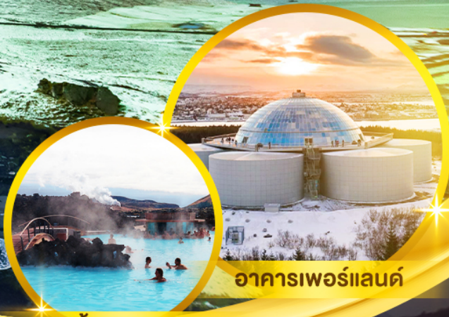
บ่อน้ำแร่บลูลาگون