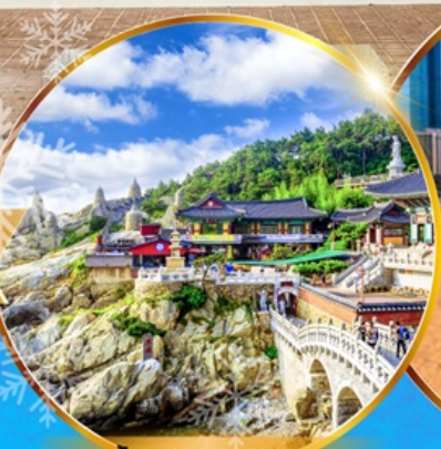
วัดแสงยงกุงซา