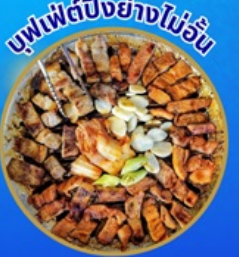
บุฟเฟ่ต์ปิ้งย่างไม่อั้น