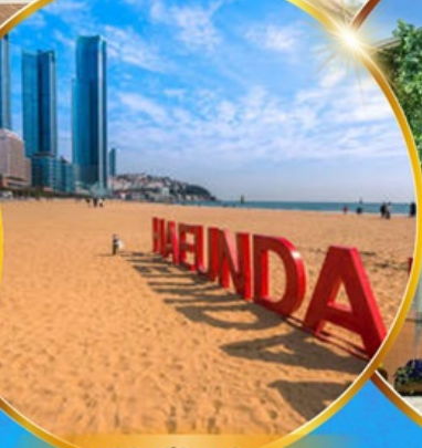
หาดแฮนแด