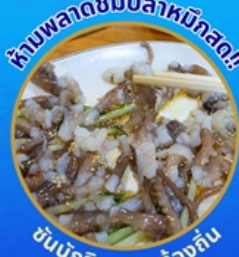
ห้ามพลาดชิมปลาหมึกสด!

โพล้งสเปซวอล์ค สกายวอร์ค ตามรอยซีรีส์ Hometown chachacha ถ่ายรูปชิคๆ หมู่บ้านวัฒนธรรมคัมซอน ขึ้นเคเบิลคาร์ ชมทะเลปูซาน นั่งรถไฟปูคปิก sky capsule ชิมของอร่อยตลาดแฮนแด อิสระช้อปปิ้ง Lotte Duty Free