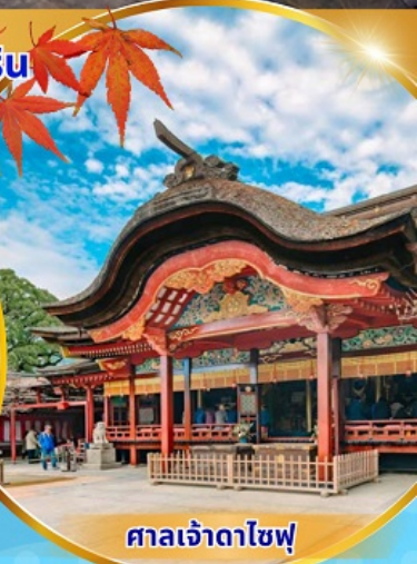
ศาลเจ้าดาไซฟู