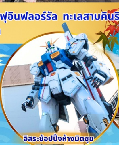
อิสระช้อปปิ้งห้างมิตซูย