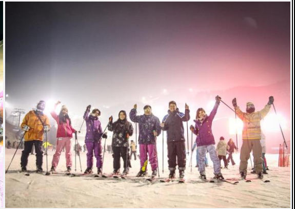
กางเกงที่เหมาะสม) ทุกท่านสามารถเล่นได้ไม่จำกัดเวลา