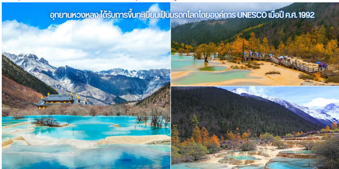
อุทยานหวงหลง ได้รับการขึ้นทะเบียนเป็นมรดกโลกโดยองค์การ UNESCO เมื่อปี ค.ศ. 1992

หมายเหตุ ** ใบบไม้เปลี่ยนสีและหิมะภายในอุทยานขึ้นอยู่กับสภาพ อากาศในแต่ละปี