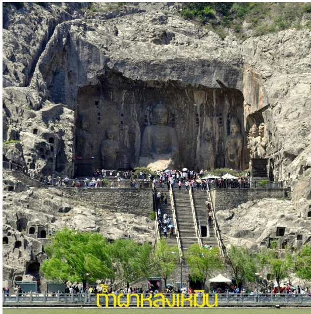
ถ้ำผาลงเหมิน

รับประทานอาหารเช้า ณ ห้องอาหารโรงแรม (4)