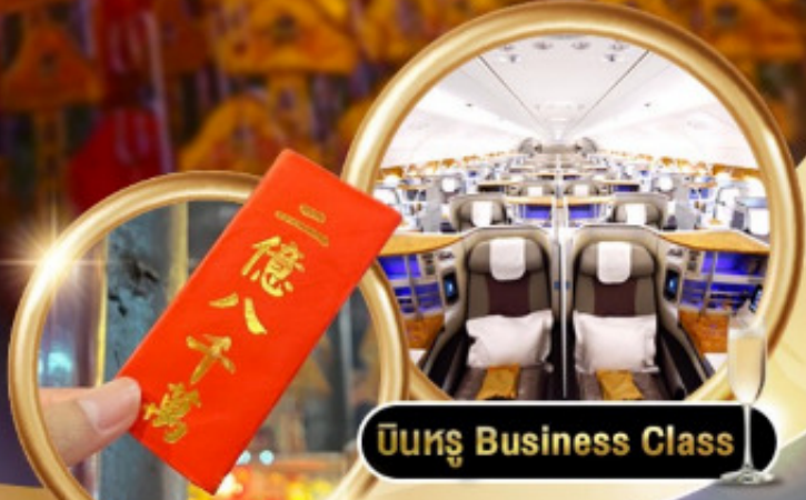
บินหรู Business Class