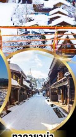
ทาคายาม่า