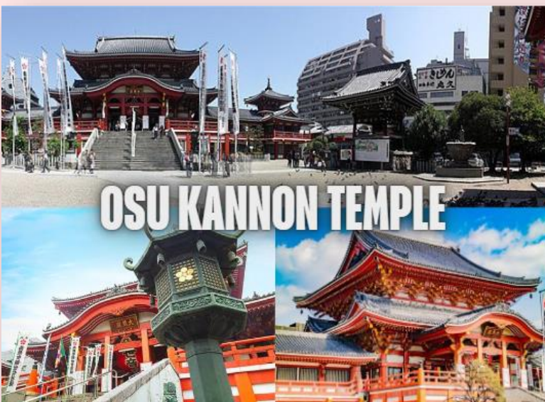
OSU KANNON TEMPLE

จากนั้นนำท่านเดินทางสู่ วัดโอสึ ดันบง (Osu Kannon Temple) เป็นวัดพุทธที่อยู่ใจกลางเมืองและมีชื่อเสียงโด่งดังของเมืองนาโกย่า ภายในอาคารหลักของวัดเป็นที่ประดิษฐานพระพุทธรูปไม้แกะสลักเก่าแก่ที่ขึ้นชื่อเรื่องความเมตตา ซึ่งชาวเมืองให้ความเคารพนับถือเป็นอย่างยิ่ง นอกจากนี้สถาปัตยกรรมสิ่งปลูกสร้างตัวอาคารของวัดยังทาสีแดงสดดูโดดเด่น และสวยงามเป็นอย่างยิ่ง บริเวณด้านหลังวัดยังมี ย่านการค้าโอสึ (Osu Shopping Arcade) แหล่งช้อปปิ้งชื่อดังอีกแห่งหนึ่งของเมืองนาโกย่า ที่ซึ่งรวบรวมร้านค้าต่าง ๆ มากมายกว่า 1,200 ร้าน มีสินค้าต่าง ๆ มากมายให้ท่านเลือกซื้อเป็นของขวัญของฝาก ตลอดจนร้านอาหาร คาเฟ่บาร์สไตล์ญี่ปุ่น ให้ท่านเลือกเชิดอินถ่ายรูปได้อย่างเพลิดเพลิน