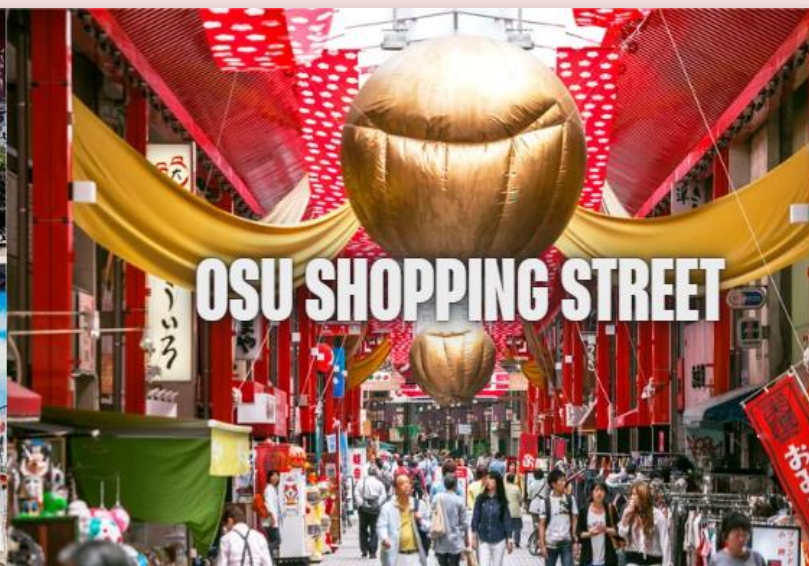
OSU SHOPPING STREET