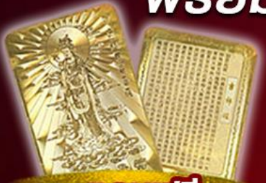
แถมฟรี แผ่นทองเจ้าแม่กวนอิม