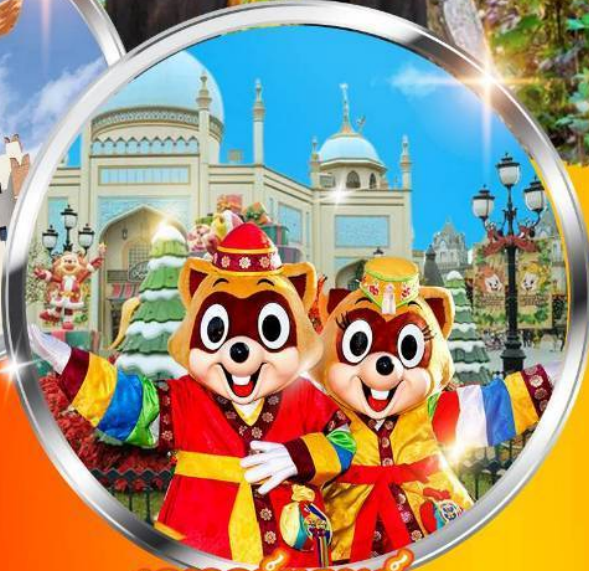
เอเวอร์แลนด์