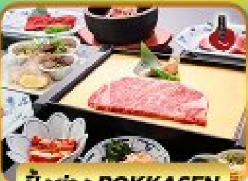
บ๊องย่าง ROKKASEN