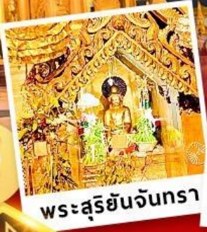
พระสุริยันจันทรา