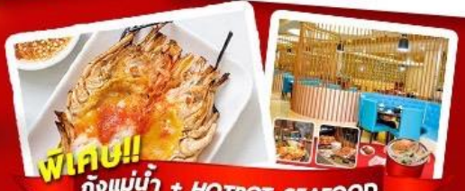
พิเศษ!! ก๊งแม่น้ำ + HOTPOT SEAFOOD