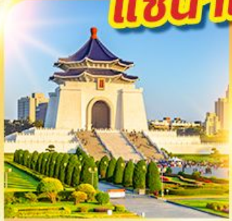
อนุสรณ์เจียงไคเช็ค

นั่งรถไฟปองปอง! ชมวิวไถ่ฝิงซาน แช่น้ำแร่ร้อนตัวในห้องพัก