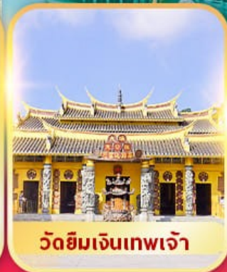
วัดยิมเงินเทพเจ้า