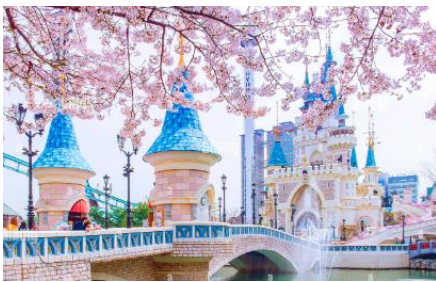
สวนสนุกแห่งนี้

หมู่บ้านบุกซอนอันอก หมู่บ้านโบราณตั้งแต่สมัยราชวงศ์โชซอน ที่ยังคงสถาปัตยกรรมแบบดั้งเดิม มองไปทางไหนก็เจอแต่บ้านทรงโบราณเหมือนที่เราเห็นในซีรีส์ ทำให้มีนักท่องเที่ยวและวัยรุ่นเกาหลีชอบเช่าชุดฮันบกมาถ่ายรูปที่นี่ จุดถ่ายรูปยอดฮิตในหมู่บ้านก็คือบริเวณเนินที่มองเห็นหอคอยโซลทาวเวอร์ รวมถึงยังมีบางส่วนของที่เปิดเป็นร้านอาหาร คาเฟ่ และเกสต์เฮาส์อีกด้วย