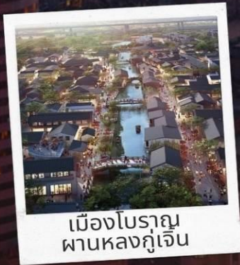
เมืองโบราณ ผานหลงกุเจิน