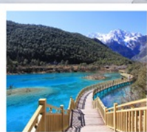
ไป๋สุยเหอ